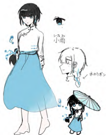
中国のキャラクター：小雨