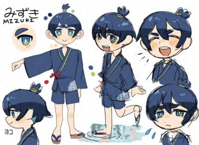
日本のキャラクター：みずき