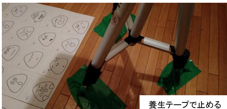
養生テープで止める

前にたおれるようなら、三脚の足(青い矢印の先)に重しをつけるといいですよ。次ページの写真④を見て！